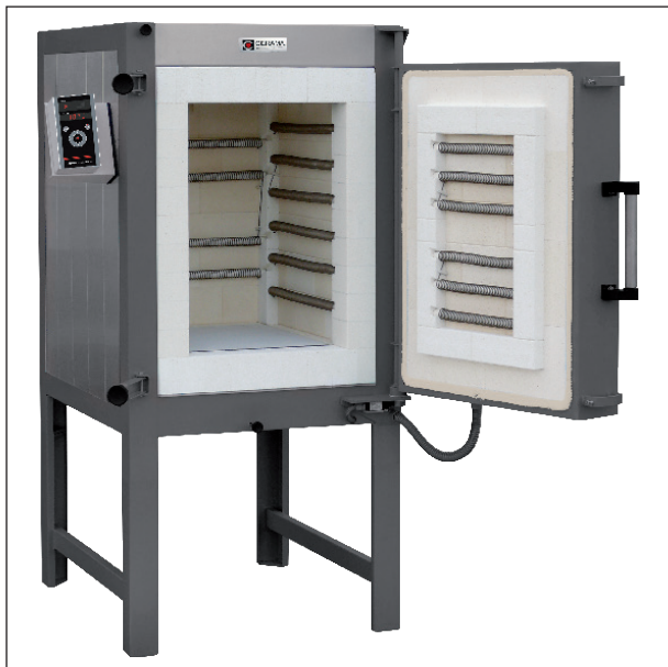
Modell KE 200-SC (Se alla modellerna och data på nästa sida).